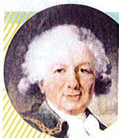
Louis-Antoine de BOUGAINVILLE (Paris 1729-Paris 1811)

➤ En quoi le voyage de Bougainville va-t-il élargir le champ de la connaissance ?