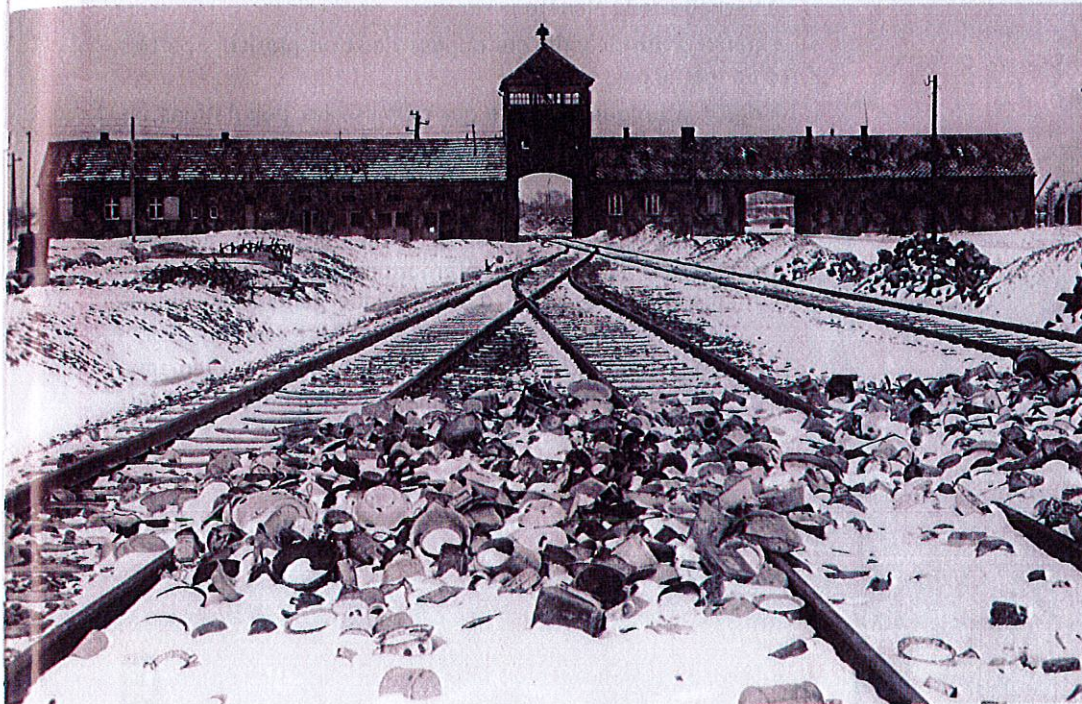
Photo prise de l'intérieur du camp d'Auschwitz-Birkenau (Pologne) entre mi-février et mi-mars 1945.

● Problématique : Pourquoi le génocide juif a-t-il été classé « crime contre l'humanité » ?