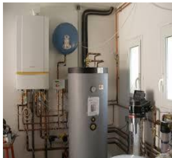
Plomberie-Chauffage - climatisation - chambres froides

Panneaux solaires et Chaudières gaz et Fioul