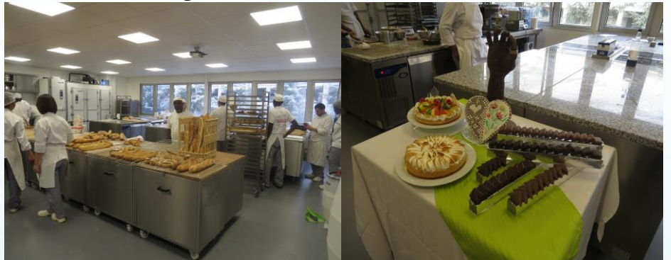
Boulangerie – Pâtisserie